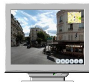
Reportages photographiques – Vues autour d'objets - Panoramas 360° en plein écran et plans interactifs