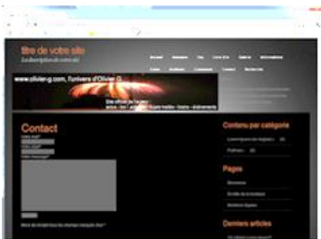
Exemple du gabarit en ligne (ici ambiance foncée) Voir sur atoutreve.fr/internet

Avec cette solution, les visuels sont plus délicats à réaliser et on reste assez conventionnel.